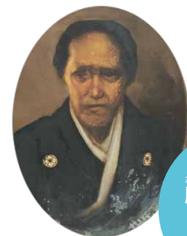
勝海舟の母・ 勝のぶ