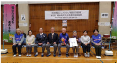
東糺谷一・二丁目ひまわりクラブ

前年度の優勝チー ム、東糺谷三丁目 長寿会から返却さ れた糺谷地区自治 会連合会会長賞の トロフィーは、東 糺谷一・二丁目ひ まわりクラブに手 渡された。