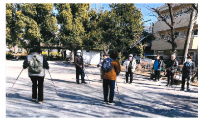
ポールウォーキング

また、不定期で行っている活動として、散策の会（年2、3回）は歩く会として有名公園散