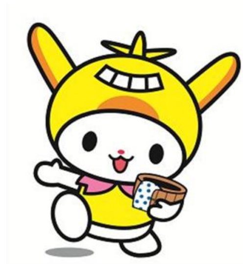
大田区公式PRキャラクター はねぴよん