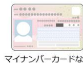
マイナンバーカードなど