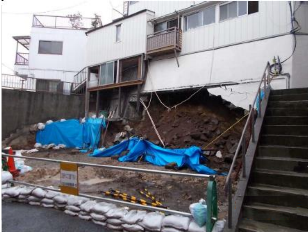
2度目のがけ崩れ発生後の状況