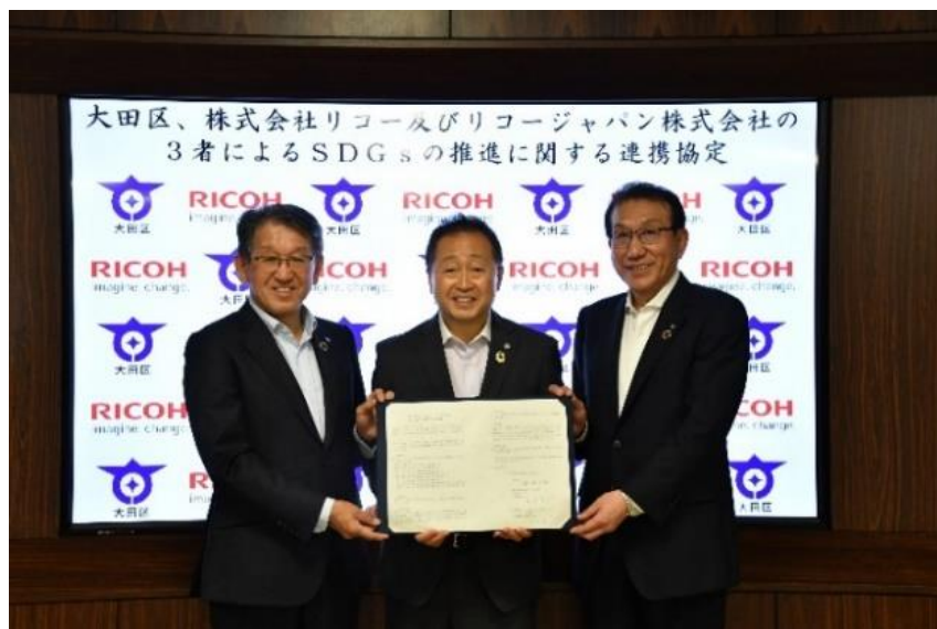
協定締結式の様子①