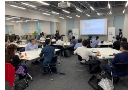
区内企業を中心とした 自主勉強会を支援 現在3つの勉強会が進行