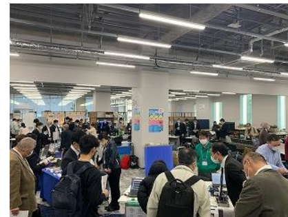
超専門技術ミニ展示会を開催 立地特性を活かした区内産業のPR