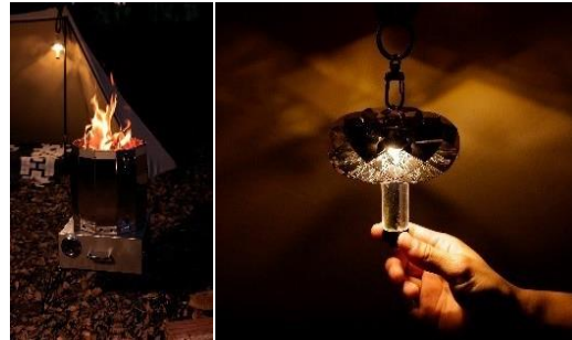
企業と大田区内の町工場 コラボレーションによる オリジナルの製品開発