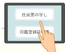
①必要な申請を選択