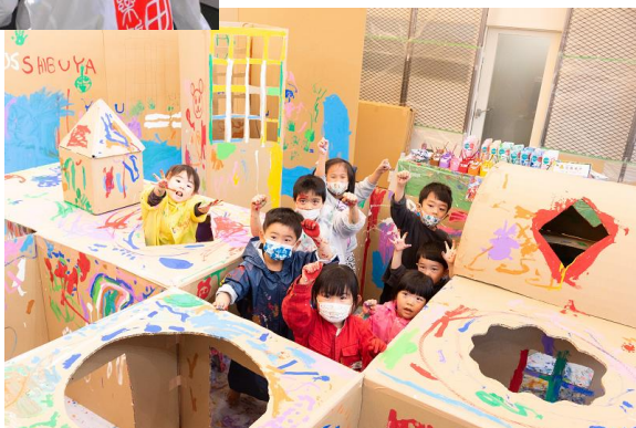
段ボール迷路ペインティング