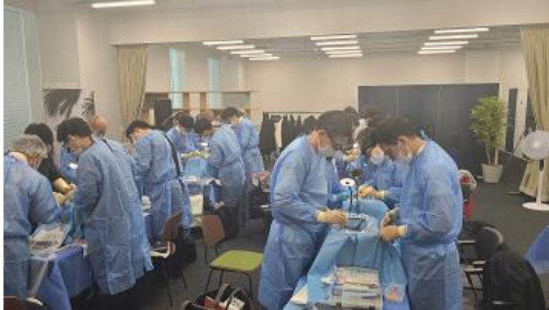
日本心臓血管外科学会 U-40との連携による 手術トレーニング