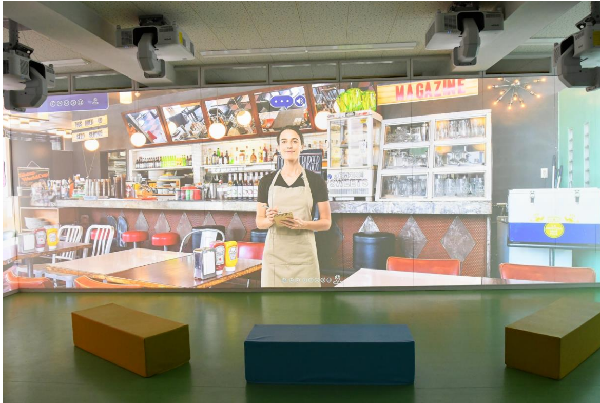
【大森東小学校OGCルーム(英語ルーム)】

以下のとおり、完成した英語ルームをお披露目します。23区初の試みである、区立小学校の中に設置したVR空間で海外の町を疑似体験している子どもたちの笑顔を見に、是非、お越しください。