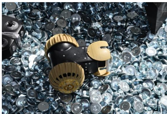
【月面探査ロボット】