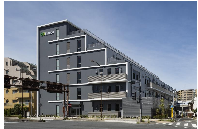
【シェア型産業創出・支援施設innoba大田】