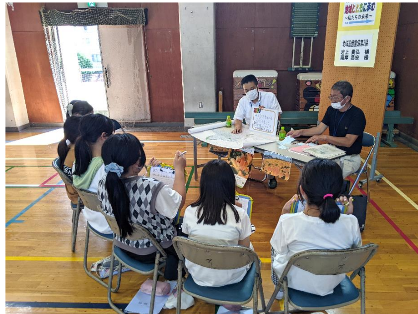
【北糀谷小学校で行われた授業の様子】