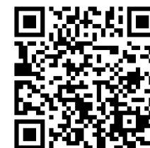
【Unique Ota HP】