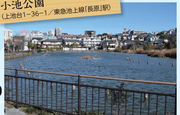
小池公園 (上池台1-36-1 / 東急池上線「長原」駅)

▲大池と呼ばれた洗足池に対し、小池として親しまれた雰囲気が復元されています。周辺整備などにより、水量や水質を保全しています。