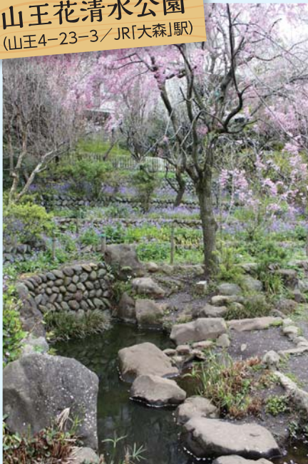
山王花清水公園 (山王4-23-3 / JR「大森」駅)

▲湧水は隣接する弁天池に流れ込んでいます。斜面地に植えられた花が四季折々、目を楽しませてくれます。