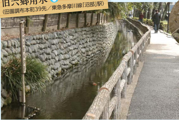
旧六郷用水 (田園調布本町39先 / 東急多摩川線「沼部」駅)

▲徳川家康の命により小泉次大夫が整備し、人々の生活を支えてきた用水が、一部復元され散策路となっています。多摩川沿いののがけ地の石積みからわき出る水が、水源として利用され、用水沿いの「洗い場跡」には歴史の面影がしのべられます。