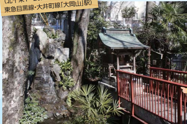
清水窪弁財天 (北千束1-26 / 東急目黒線・大井町線「大岡山」駅)

▲千束の谷のがけからわき出した清水が池となったものです。洗足池の水源の一つで、かつては付近の水田のかんがい用水として利用されていました。