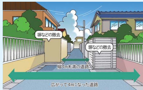
区による拡幅工事のモデルケース▶

防災面や通風、採光などの環境面、また緊急車両などの通行のためには、最低でも4mの道幅が必要です。区は、幅4mに満たない「狭あい道路」(建築基準法第42条第2項道路)の拡幅整備を推進しています。