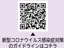
新型コロナウイルス感染症対策のガイドラインはコチラ