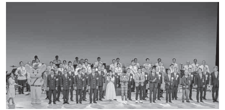
令和5年度開催時の様子

問 当日会場へ 問 都市基盤管理課交通安全・自転車総合計画担当 ☎5744-1315 FAX5744-1527