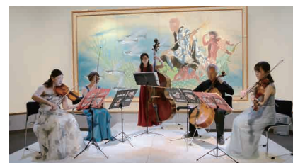
前回の演奏会の様子

5月25日(土) 午後6時30分～7時30分 抽選で50名 申 問合せ先へFAXか往復はがき(記入例参照)。5月10日必着 ※1通2名まで 会 龍子記念館 (〒143-0024中央4-2-1) ☎FAX3772-0680