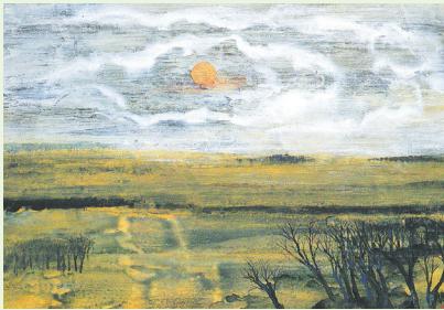
高頭信子《原野花雲》1989年

日 5月10日(日)まで 会 馬込アートギャラリー TEL 6410-7960 FAX 6410-7962