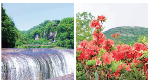
吹割の滝 湯の丸高原・レンゲツツジ

対 代表者が区内在住か在勤の方 日 6月21日(日)・22日(月)(1泊2日) 費 29,800円 (小学生以下は28,000円)から 定 抽選で42名 問 休養村とうぶ (長野県東御市和6733-1) TEL 0268-63-0261