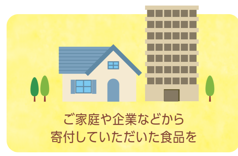
ご家庭や企業などから 寄付していただいた食品を