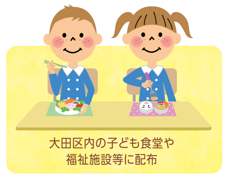
大田区内の子ども食堂や 福祉施設等に配布

主催者: おおたフード支援ネットワーク(大田区社会福祉協議会×ボランティアチーム フードバンク大田)