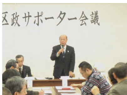
区政サポーターに感謝の弁を伝える区長