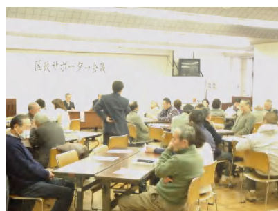
区政サポーターからの“一分間スピーチ”