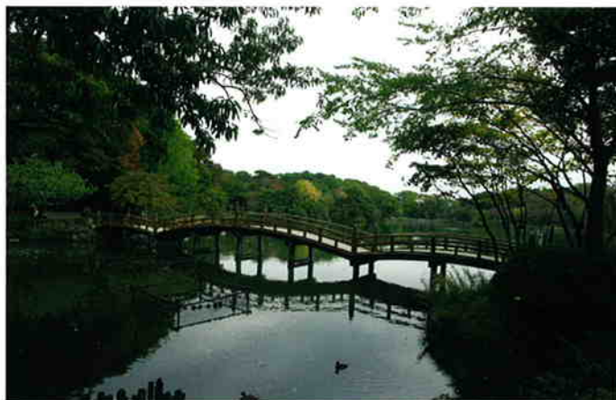
まちの潤い・憩いの場となる緑と水辺

暮らしと産業が接する職住一体のまちとして、ものづくりや商業、観光などの多様な産業が地域の魅力をさらに高めるまちをつくります。