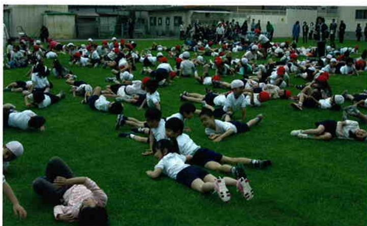
特色ある学校づくり(校庭の芝生化)