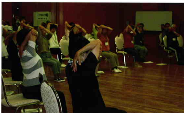
区民の健康づくり活動

また、生活に支えが必要となったときに、いつまでも住み慣れたまちに住み続けることができるよう、質の高い介護・医療体制や権利擁護の仕組み、家族への支援を充実させるとともに、地域ぐるみで高齢者を見守る、安らぎのまちをつくります。