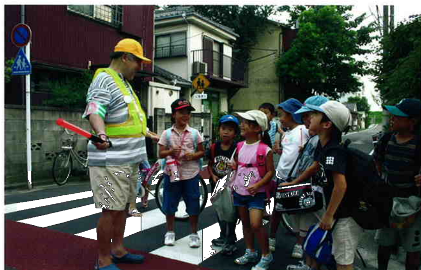
子どもの安全・安心を支える地域のか