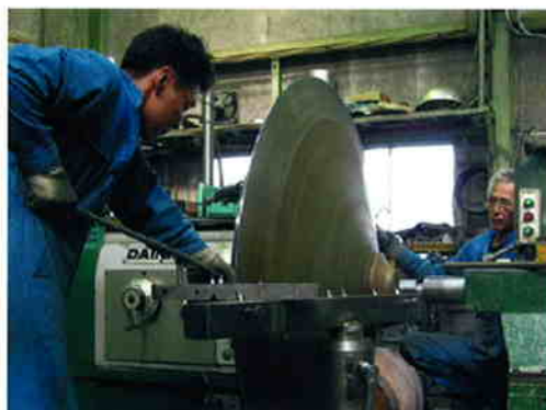
ものづくりの集積地大田区