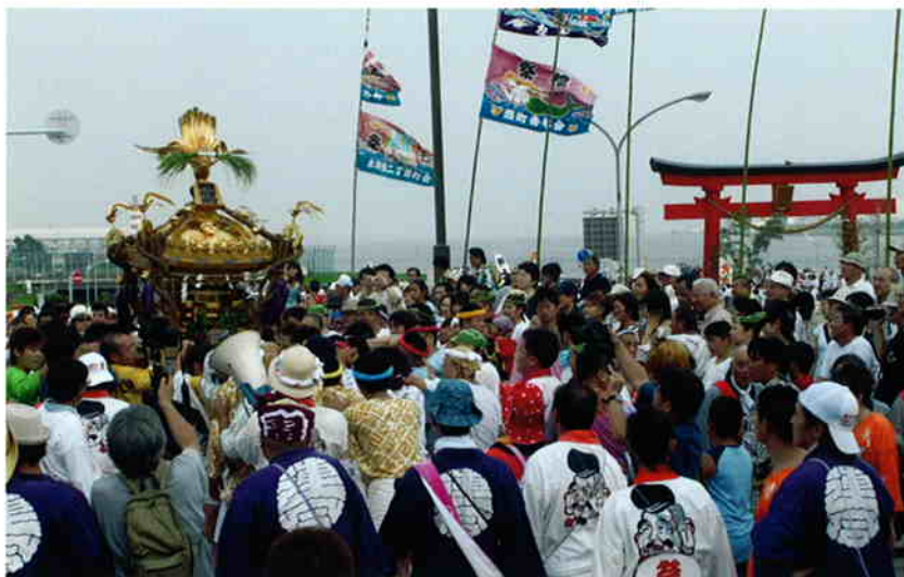
地域に根付く歴史と文化