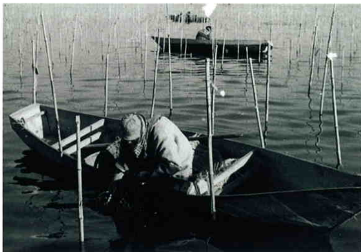
かつての大森の姿（海苔の収穫作業）

したがって、基本構想は、区民と区政の共通の目標であり、今後の区政運営の指針となるものです。