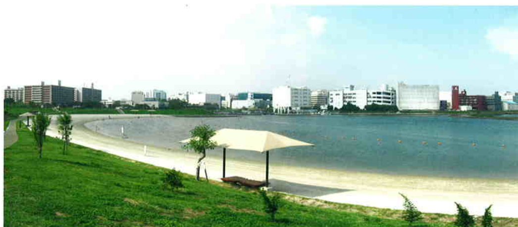
現在の大森の姿（大森ふるさとの浜辺公園）