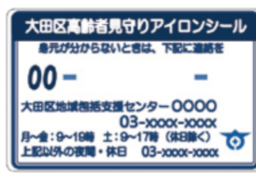
高齢者見守りアイロンシール

認知症などで高齢者が保護されたときに、いち早く身元や連絡先の情報提供をすることができます。高齢者見守りキーホルダーを携帯するのが難しい方へ配布しています。