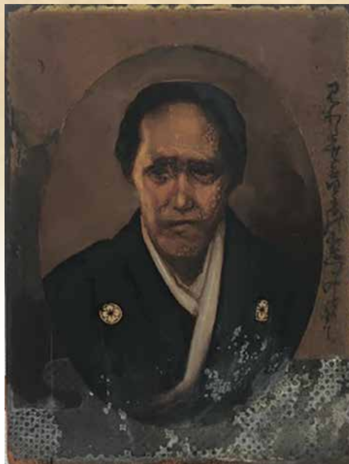
海舟の母の肖像画(修復前)