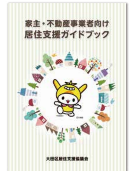
家主・不動産事業者の皆さま向けガイドブック