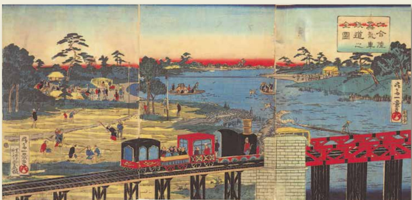
昇斎一景「六合陸蒸気車鉄道之全図」(明治4年)