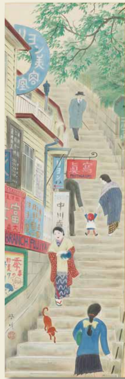
安西啓明「大森駅八景坂」(昭和3年頃)