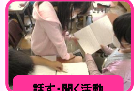
話す・聞く活動 自分の考えを伝える