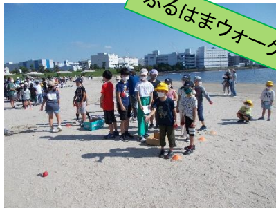
ふるはまウォークラリー