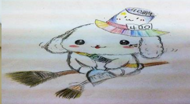
校外班40周年 マスコット