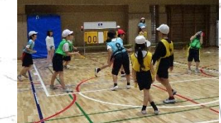
タグラグビーの授業