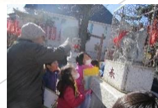
浦守稲荷神社での学習