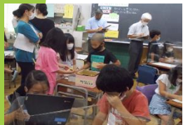
「学び合う」学習の重視