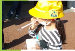
生活科の体験学習