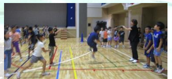
年間を通した長なわの取組