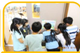
2年生が1年生に学校を案内