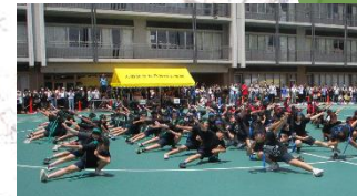
運動会 5年生の表現