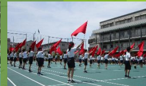
運動会 6年生の表現