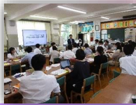
校内研究 おおたの未来づくり

通学路のみならず学校内の安全点検にも取り組み、安心して生活できる学校づくりを目指します。