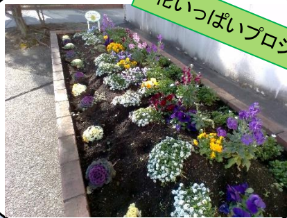
花いっぱいプロジェクト