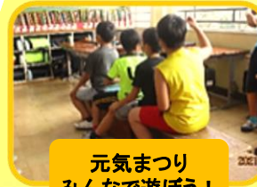
元気まつり みんなで遊ぼう！