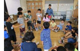
たてわり班交流活動