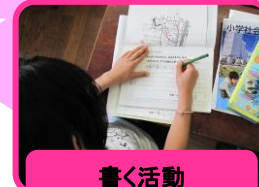
書く活動 自分の考えが書ける

基礎・基本の充実を目指して、「伝え学び合う活動」を重視します。これらの力を身に付けさせるため、「書く」事、「話す・聞く」事の大切さを重点に指導を行います。