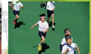
大田区小学生駅伝大会