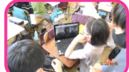
伝え学び合う活動 友達と考えを交流する

心の教育の取り組みを推進し、確かな規範意識を身に付けた思いやりのある児童を育てます。 集会活動や学習活動を通じて異学年の児童が交流できる機会を設けています。また、下級生と関わる経験から優しさを、上級生と関わりながら相手を敬う心の醸成を図ります。