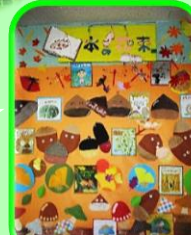
図書ボランティア