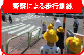
警察による歩行訓練

児童一人一人に自分の健康に関心をもたせます。1年を通じて体育の学習時間や集会活動の時間、また、休み時間を活用して体力の向上と健康の保持・増進に努めます。 さらに、栄養士を中心に、発達段階に応じた「食に関する指導」を行い健康推進教育の充実を図っていきます。