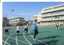
アスリートによる授業