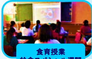
食育授業 給食スペシャル週間