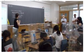
社会科の学習発表