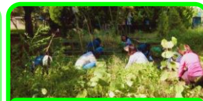
ガーデニングボランティアによる 環境整備

学校支援地域本部「スーパードクター」と連携して地域の人材・教育力を積極的に活用して学校教育の充実を図っていきます。