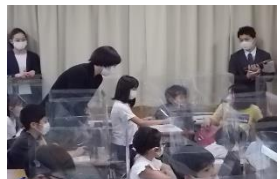
校内研究「主体的・対話的に学ぶ様子」