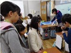
大四子ども遊び集会