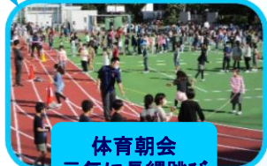
体育朝会 元気に長縄跳び