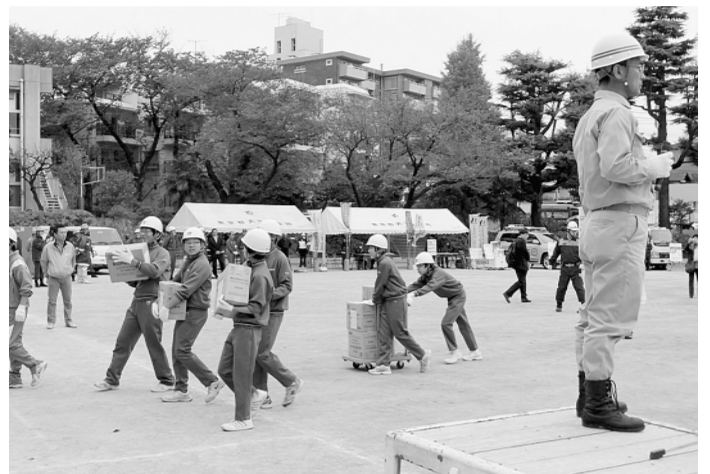
▲救援物資の受入訓練

平成25年2月に、馬込第三小学校においても学校防災活動拠点の運営訓練を実施する予定です。