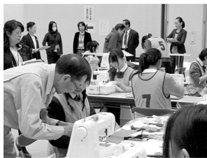
▲ものづくり競技会

区立小・中学校によるものづくり体験や職場体験のステージ発表、各学校で制作した作品の展示発表、区内中学校代表生徒によるものづくり競技会（技術・家庭科 技能コンテスト）を行います。