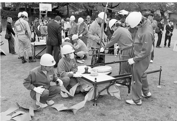
▲仮設トイレの設置訓練