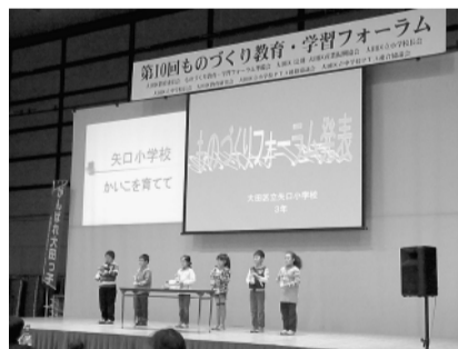
▲小学生のステージ発表