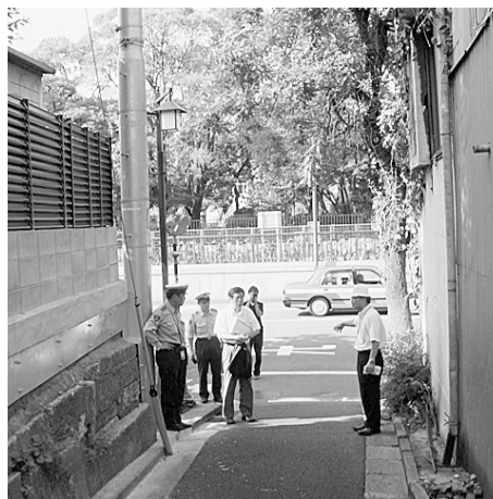
▲交通量が多く狭い道

昨年4月以降、登下校中の児童等の列に自動車が入り込んだことによる交通事故が相次ぎました。