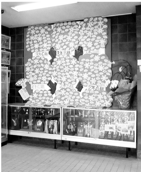
▲生徒たちの決意などが書かれた「かしの木」