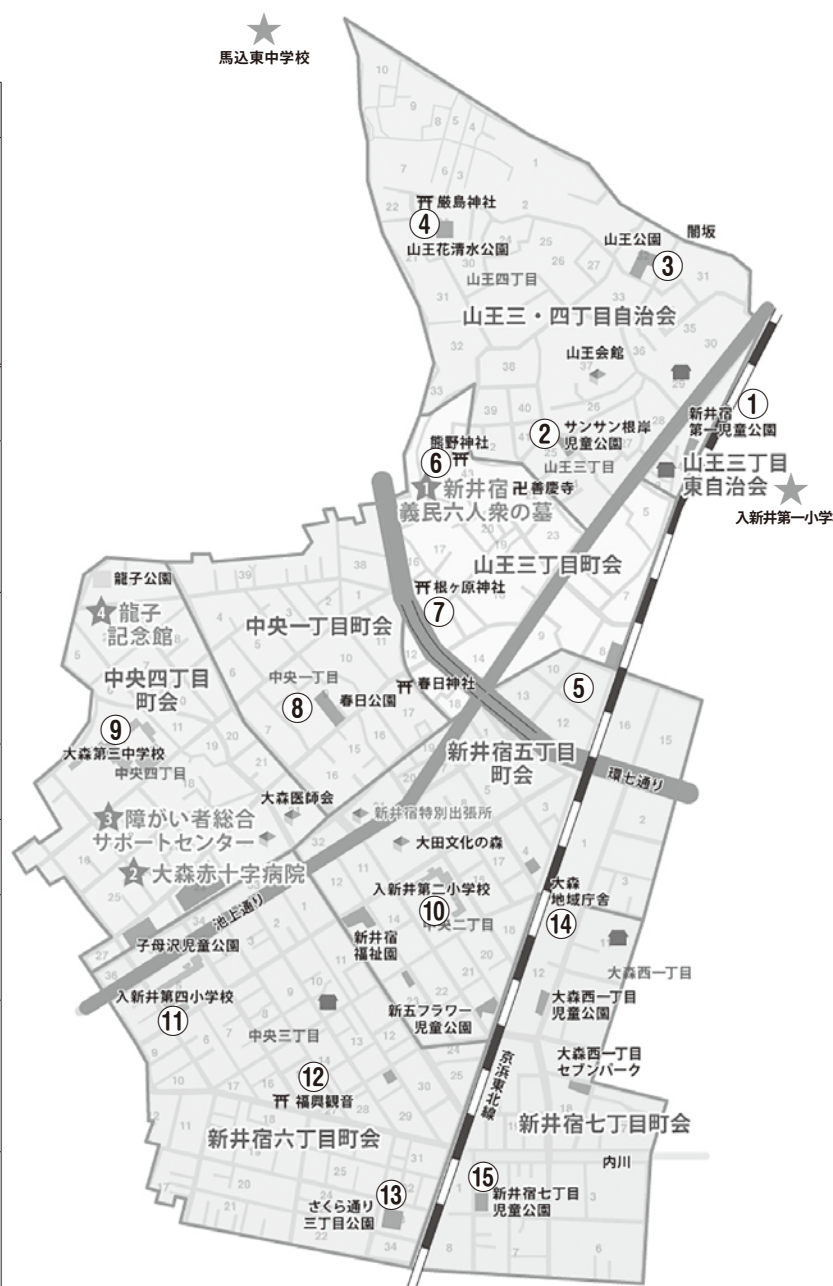
▲新井宿地区マップ▲

※入新井第二小学校は、現在改築工事中ですが、避難所としての機能は兼ね備えております。新井宿五丁目町会、新井宿七丁目町会の皆様につきましては、引き続き入新井第二小学校を避難所としてご利用ください。