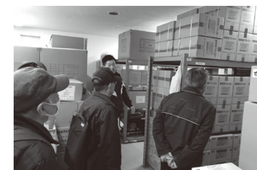
◀業者による棚卸作業後、熱心に説明を聞く地域の方々。倉庫内には、十分な通路が確保されました。

大田区では、令和5～7年度にかけて、学校防災備蓄倉庫内の備蓄物品の状況を精緻に把握し、迅速かつ円滑に活用できるよう、倉庫内の棚卸とレイアウト構成の作業を行っています。新井宿地区では、令和5年度に大森第三中学校で実施されました。これに続いて、令和6年度に入新井第四小学校、令和7年度に入新井第二小学校の作業が予定されています。