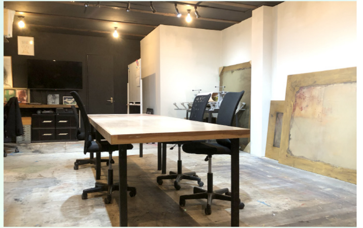
アーティストのオーラを感じるスタジオ内部