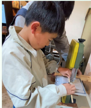
自由かつ黙々と制作する造形教室のこどもたち