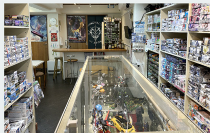
入り口から奥へと下っていく居心地のいい店内