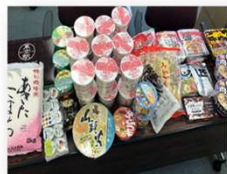
集まった食品は・・・