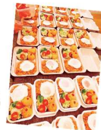
子ども食堂やフードパントリー団体等で活用されています！