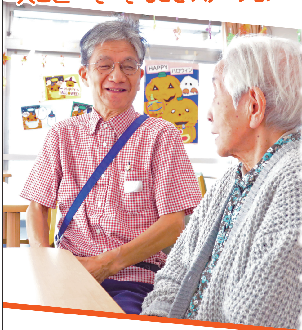
区内の高齢者施設にて就業中の 生活支援員※写真左 協力: 社会福祉法人 池上長寿園