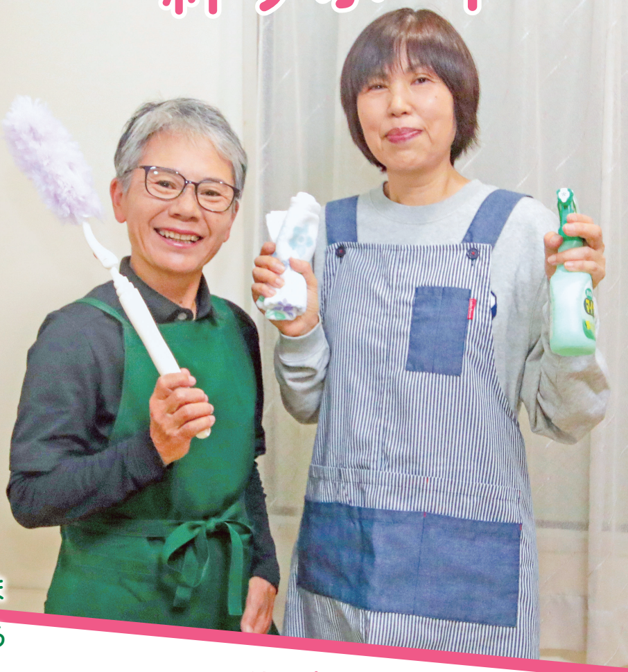
絆サポートで 活躍しているおふたり