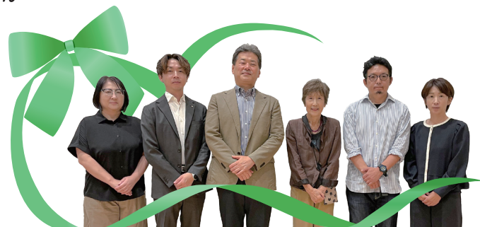
福祉教育セミナー「共に生きる力を育む」登壇者の皆さま 2025/9/23

編集・発行 社会福祉法人 大田区社会福祉協議会 〒144-0051 東京都大田区西蒲田7-49-2 ☎ 03-3736-2021 FAX 03-3736-2030 🌐 https://www.ota-shakyo.jp 📺 https://x.com/ota_shakyo