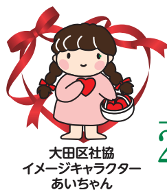
大田区社協 イメージキャラクター あいちゃん