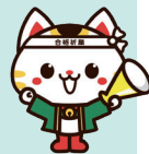
当事業キャラクター チャレンジちゃん