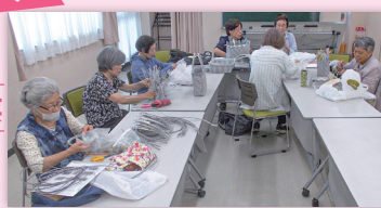
つどいの場:エコクラブの会