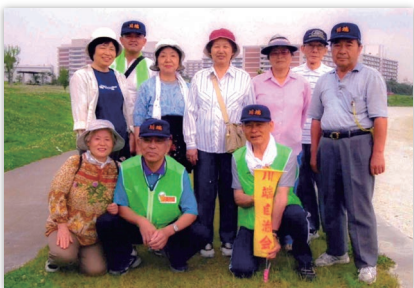
大森ふるさとの浜辺公園にて

「大山詣」というのがあります。ご存じでしょうか。漁師や漁河岸関係の方々が講社をつくり、夏になると先達さんと一緒に行ったものです。大森には、浜端、浦守、メンダ九丁目、堀之内に講社がありました。登山の帰りに下山祝いとして、宿坊で豆腐料理に舌つみしたものです。