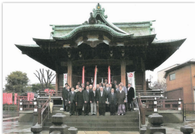
「浅草三社様」役員の皆さま

五代将軍徳川綱吉の時代に生類憐みの令が発令され、浅草隅田川十六丁四方の漁業が禁止され、浅草隅田川で漁をしていた漁師が大森に移動してきたと言われ「三社権現の祭礼には必ず大森から船を出し、この船が浅草に到着しない時は祭が出来なかつたと云はれ……（大森区史）」とある様に、浅草と大森の両地はご縁が深かつ