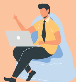
ものづくり相談者

ものづくり相談者ともものづくり事業者が共に挑戦・成長していくプラットフォームです