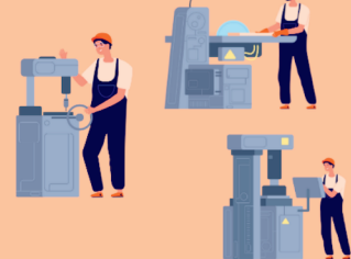
ハブ企業・ものづくり事業者