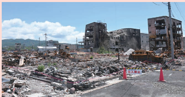
令和6年能登半島地震