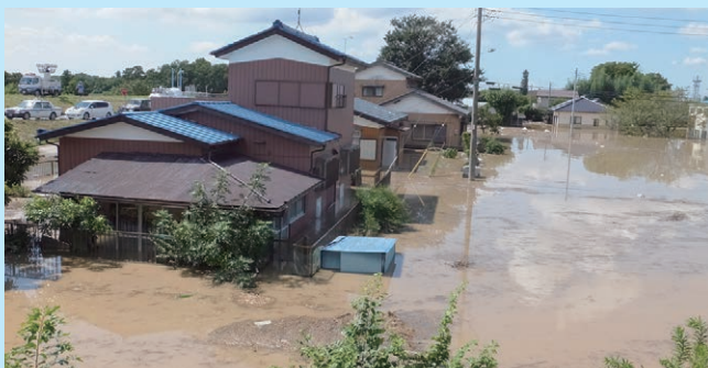
平成27年鬼怒川堤防決壊