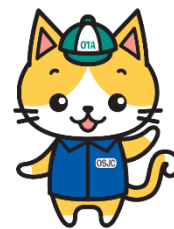
シルバー人材センター