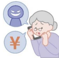
自動通話録音機の貸与