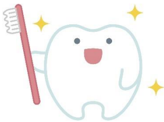
ねたきり高齢者訪問歯科支援