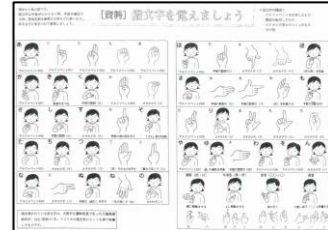
障がい当事者及びご家族による講話レジュメから一部抜粋 (上：大田区精神障害者家族連絡会、下：聴覚障がい当事者)