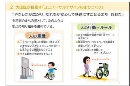
「大田区ユニバーサルデザインのまちづくり」 講義資料から一部抜粋