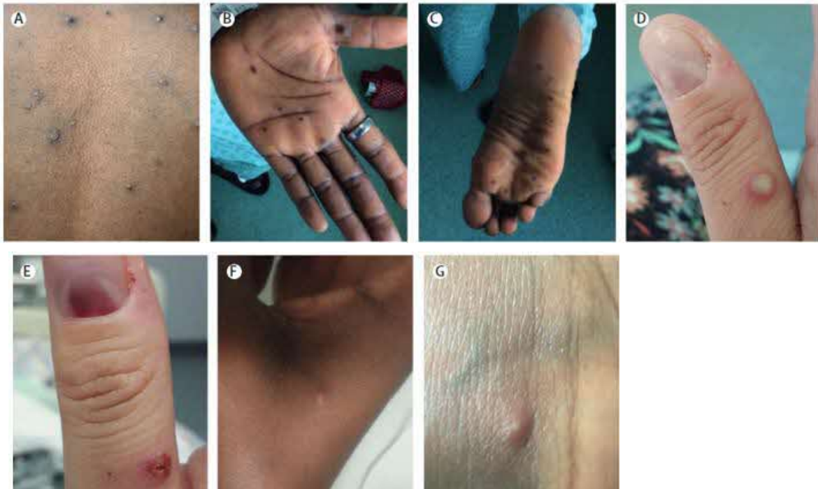
(文献 1) サル痘と鑑別が必要な発疹性疾患 (文献 3 Table1 をもとに感染研で訳)

A: 小水疱、B, C: 手掌、足底の斑点状の皮疹、D: 膿疱と爪下病変、E: 爪下病変、F, G: 小丘疹、小水疱