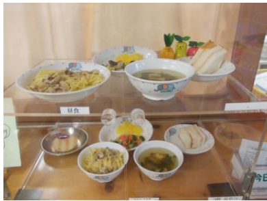
給食のサンプル展示