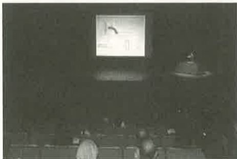
たかせクリニック理事長・医学博士 高瀬 義昌先生による講演