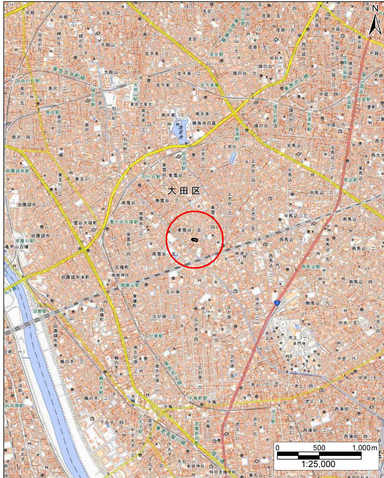
「この地図は地理院タイルを加工して作成」