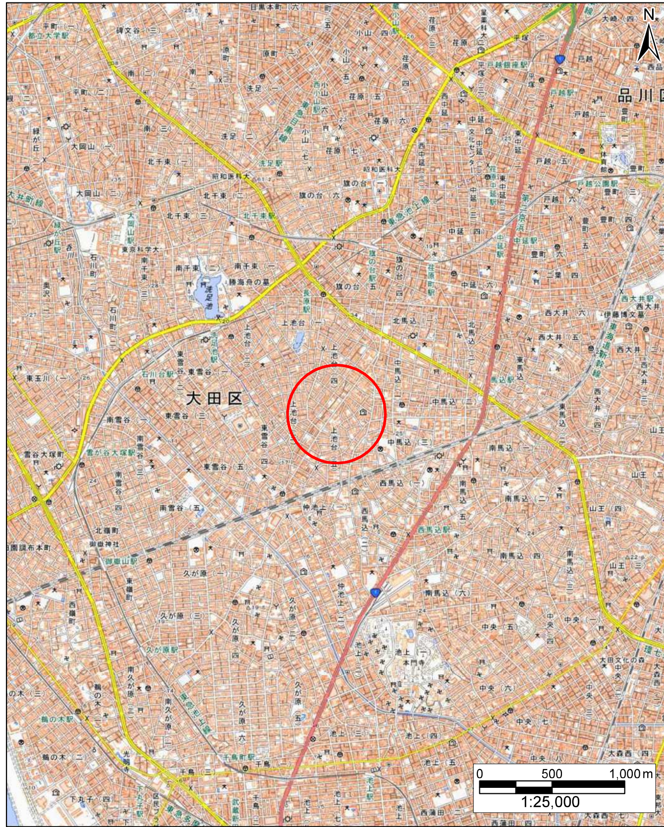
「この地図は地理院タイルを加工して作成」