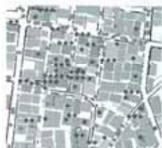
シミュレーションによる地震時のまちの様子