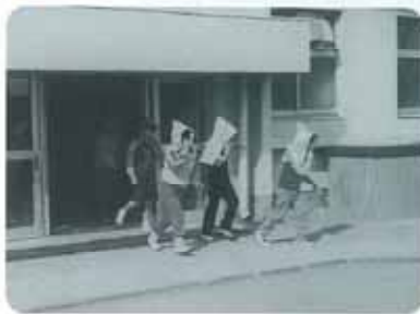
東蒲小学校での避難訓練の様子

また毎年9月には、学校にいる時に子ども達が災害にあった場合、安全に親元へ帰れるように、保護者による引取り訓練も行っています。