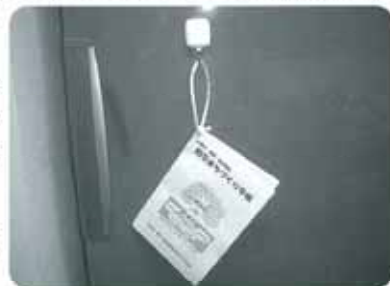
ひもを通して、目につくところにかけてください。

「非常連絡先カード」という、みなさんが各自記入して携帯していただける欄もつくりました。是非、ご利用ください。