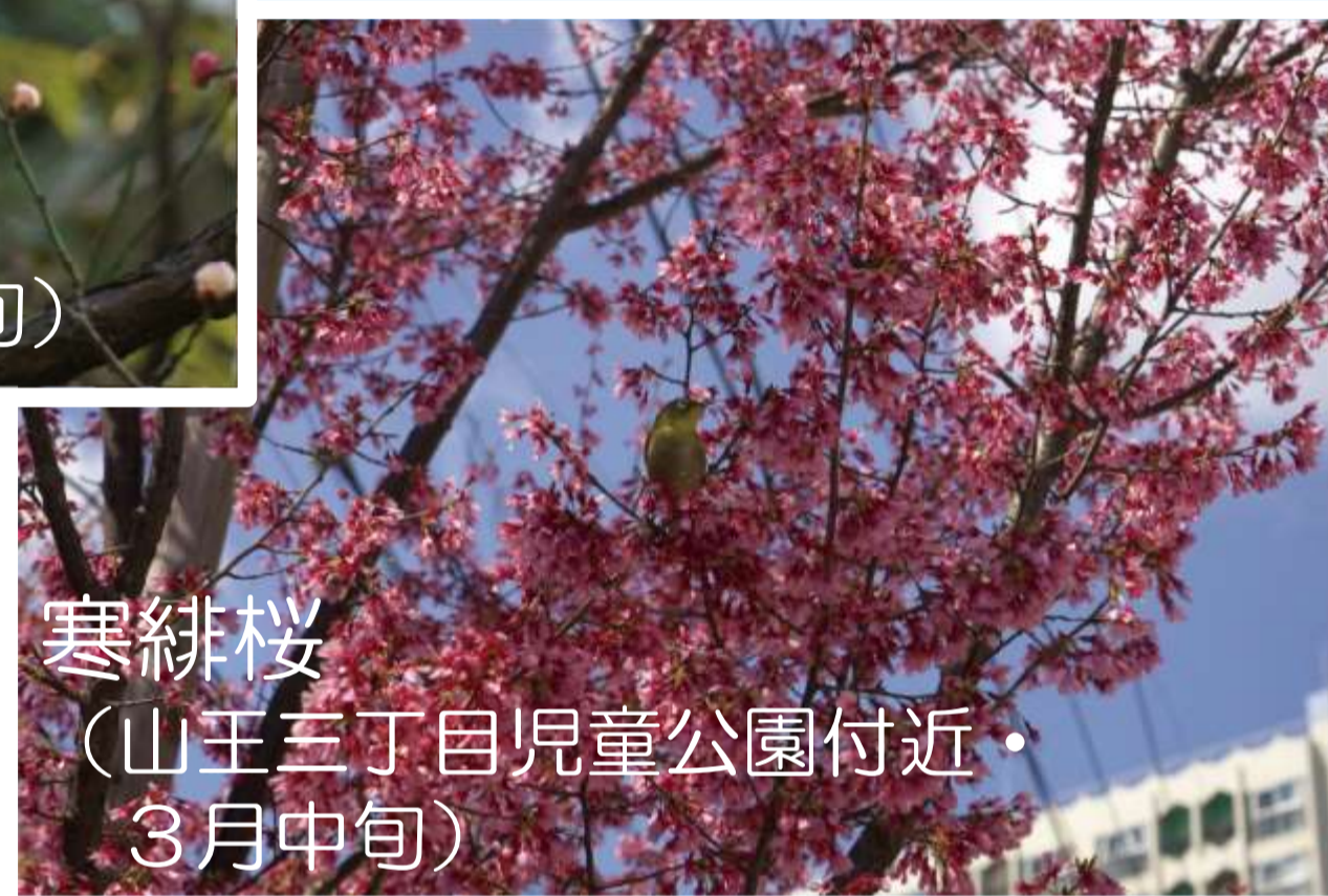
寒緋桜 (山王三丁目児童公園付近・ 3月中旬)