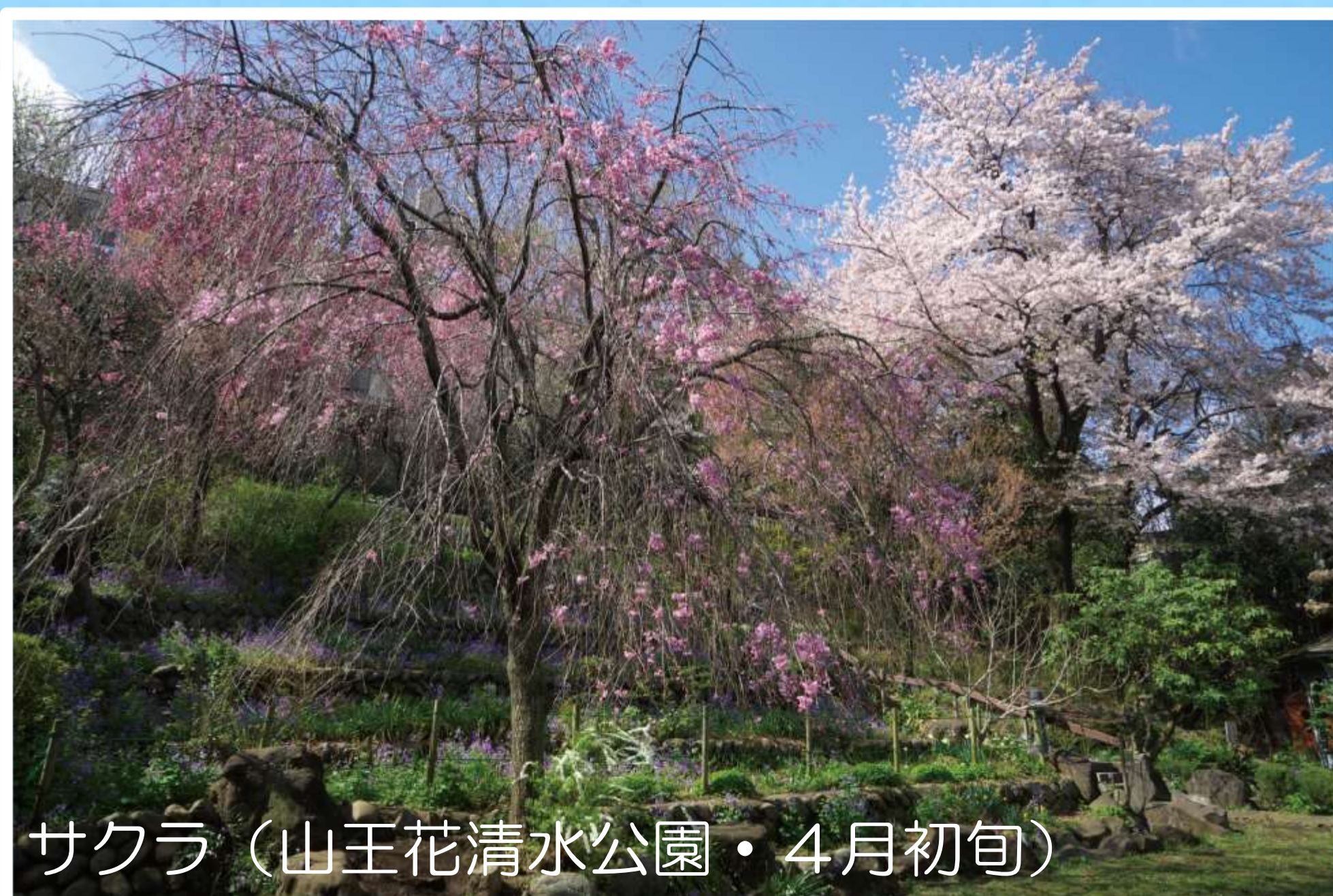
サクラ (山王花清水公園・4月初旬)