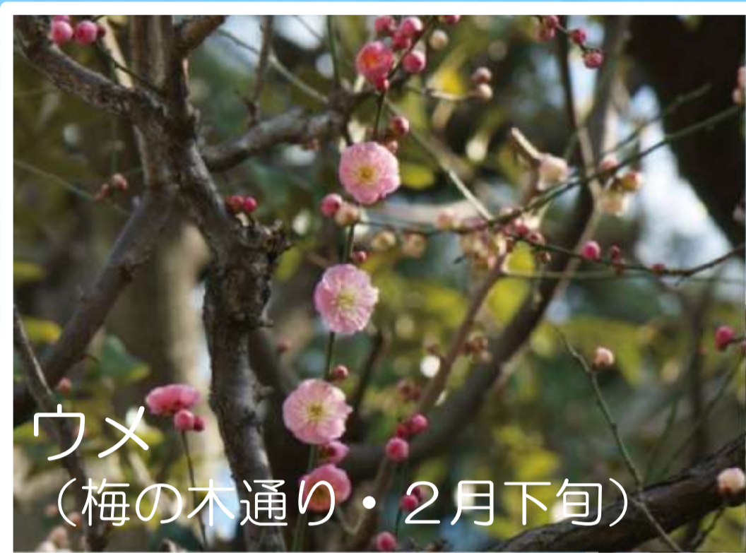
ウメ (梅の木通り・2月下旬)