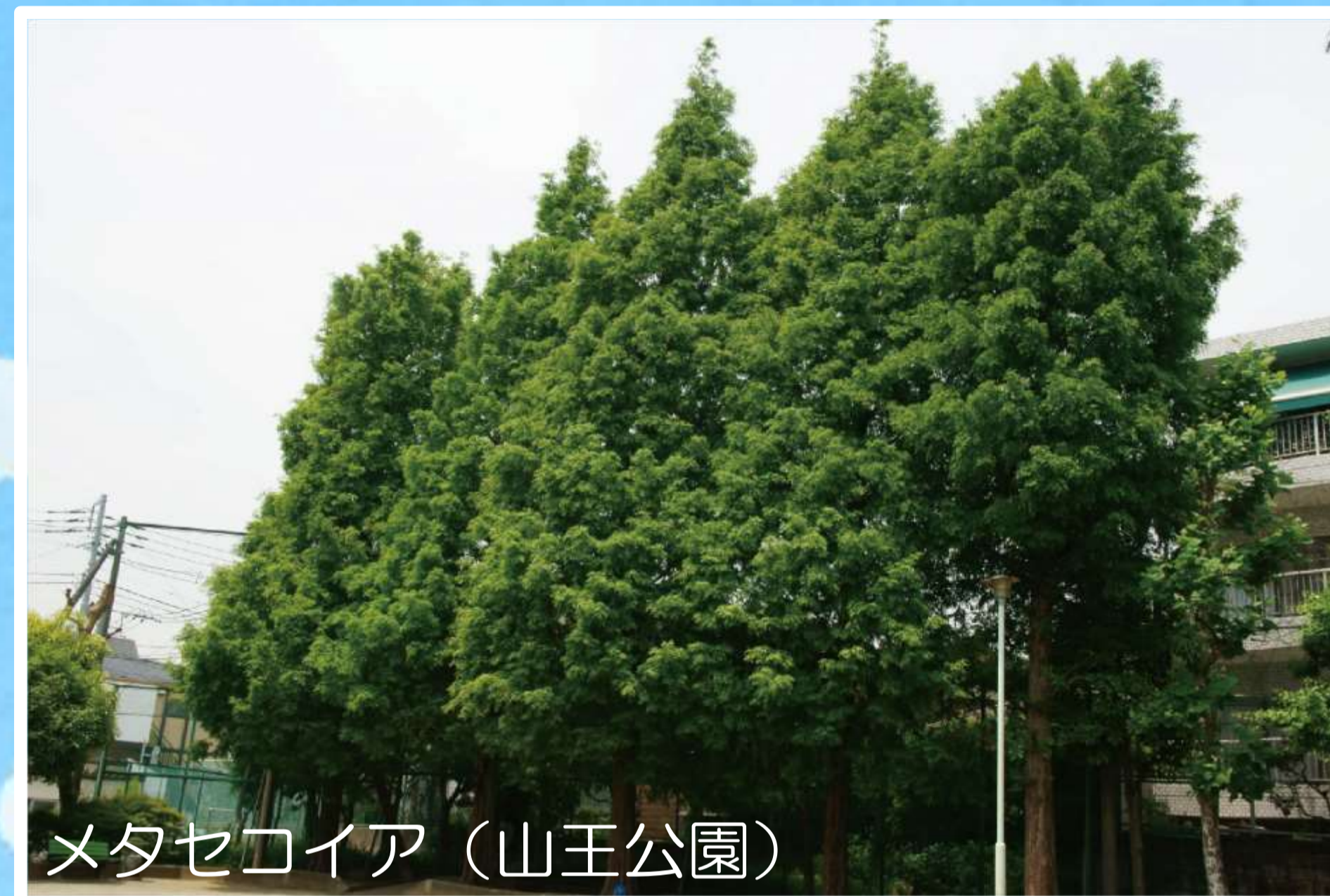
メタセコイア (山王公園)