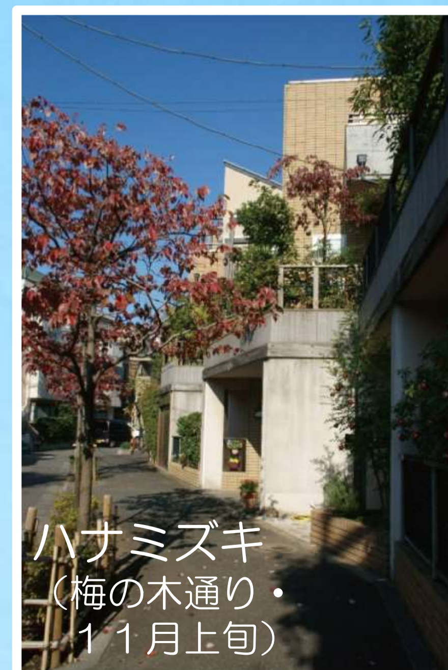
ハナミズキ (梅の木通り・ 11月上旬)