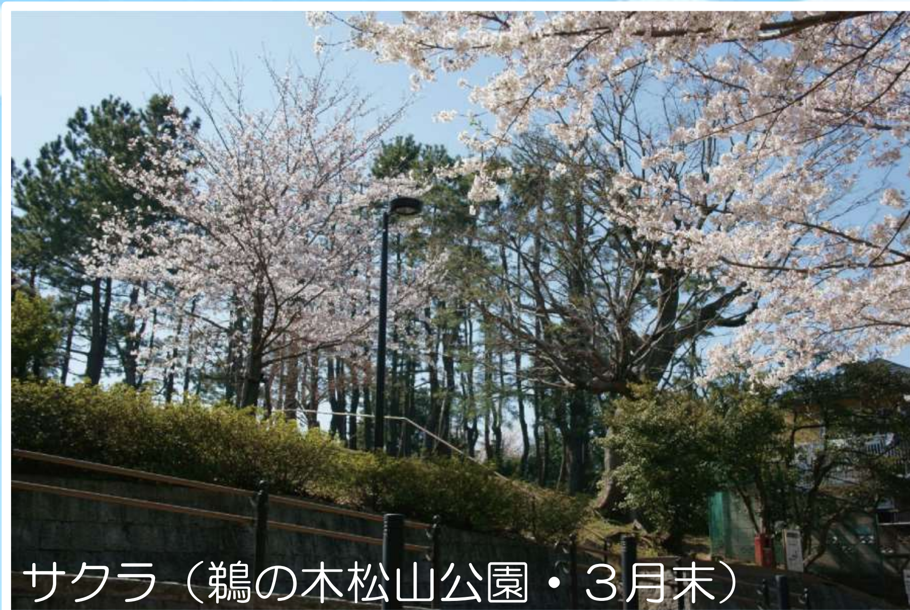
サクラ (鶺鴒の木松山公園・3月末)