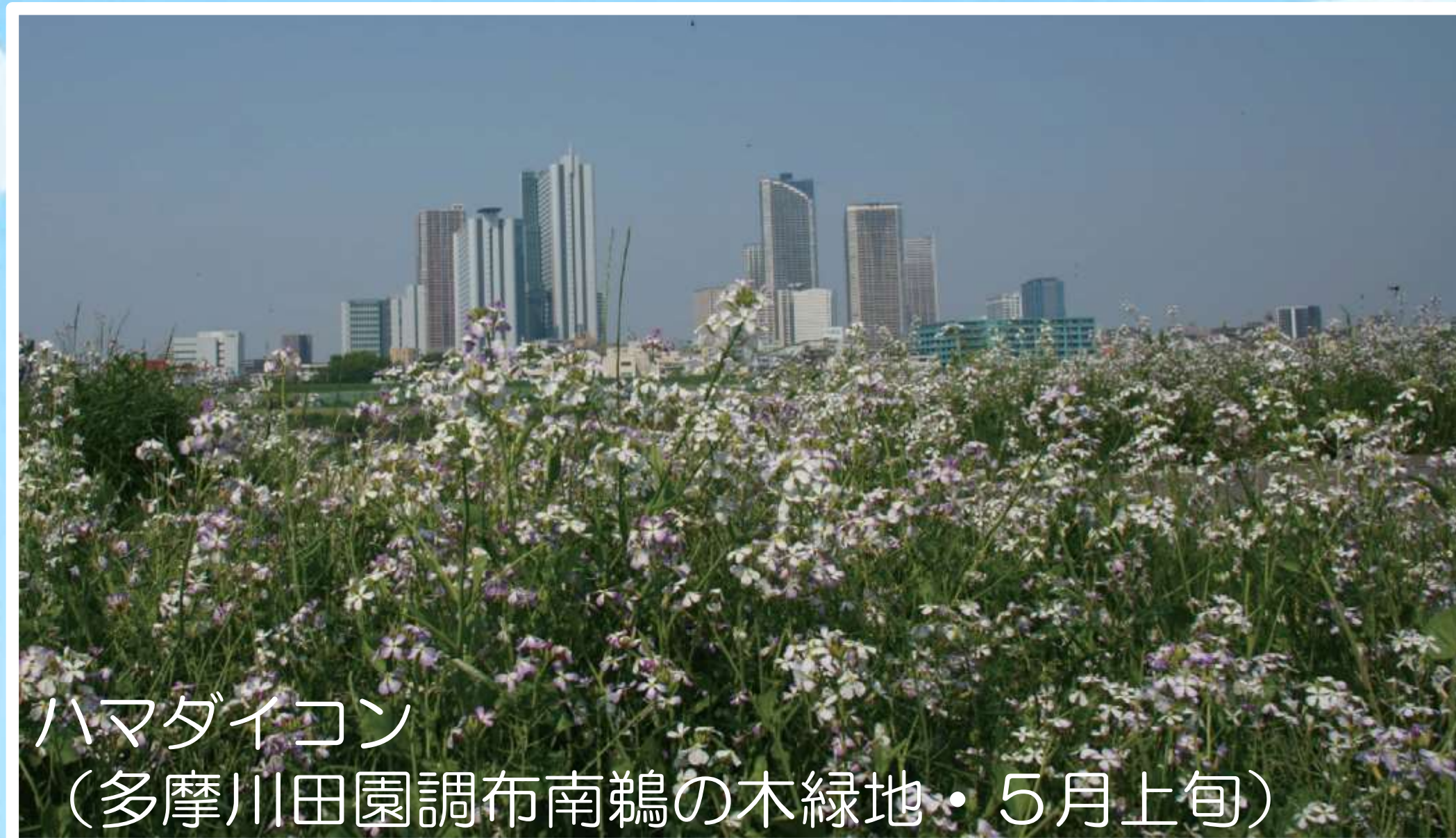
ハマダイコン (多摩川田園調布南鶺鴒の木緑地・5月上旬)