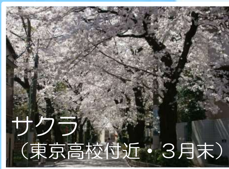
サクラ (東京高校付近・3月末)