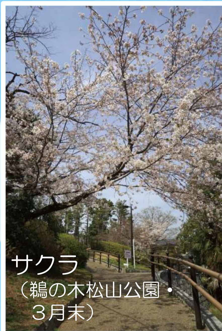
サクラ (鶺鴒の木松山公園・ 3月末)