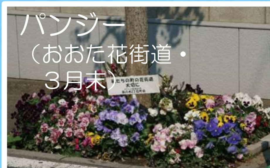
パンジー (おおた花街道・ 3月末)