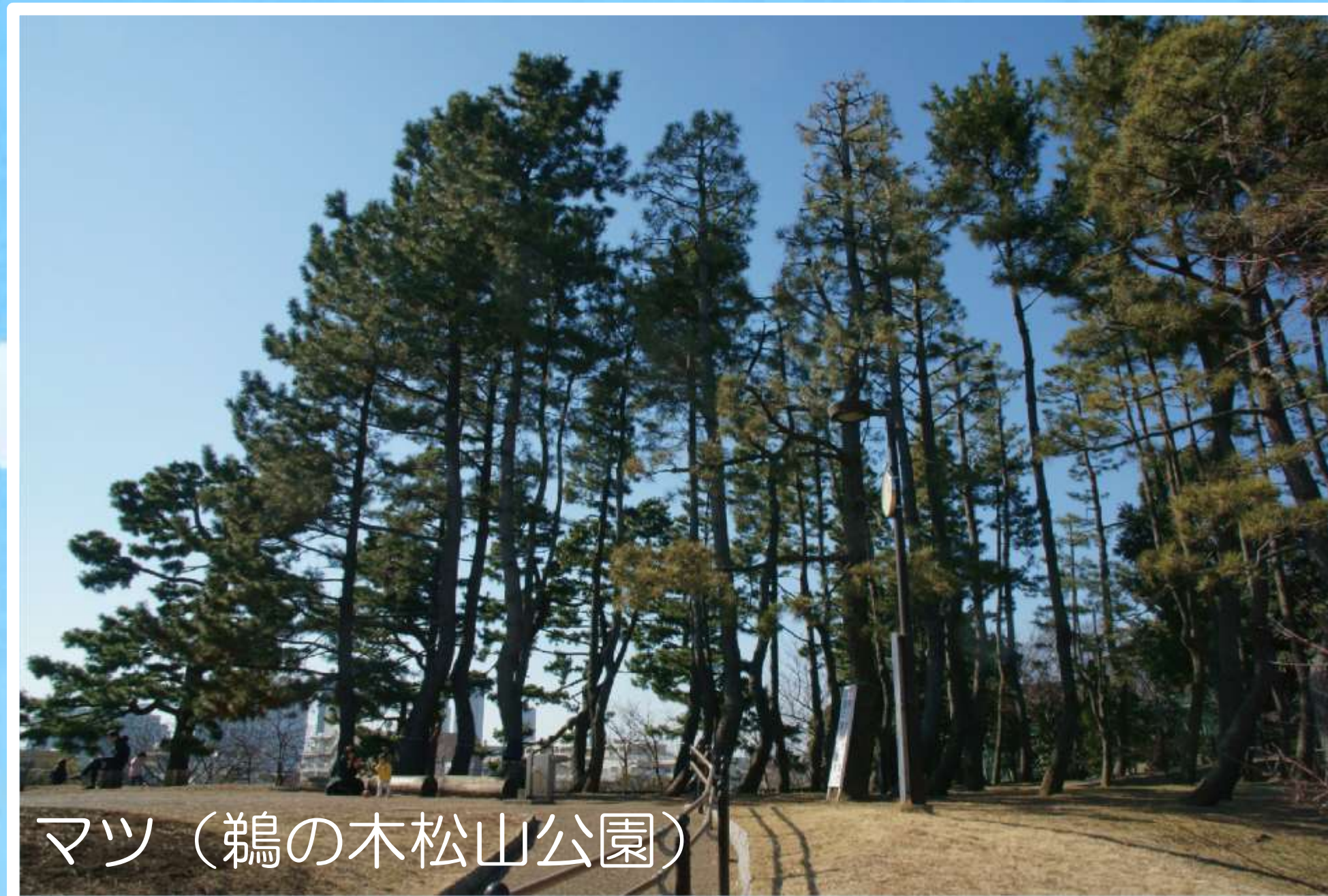
マツ (鶺鴒の木松山公園)