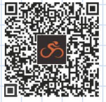
当日の詳細ルート

「おおたさんそうマップ」は、大田区での散走を楽しむアイテムのひとつ。おおたさんそうマップを使って、新たな大田区の魅力にふれてください。ご自身やご家族、お友達と散走やマップ作りを楽しんでくださいね。