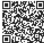
自転車の安全利用