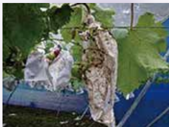
▲アライグマによる ブドウの食害