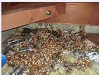
▲ハクビシンによる 天井裏の糞害 ※果物の種を含む ことが多い