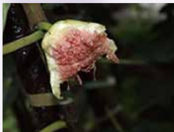
▲ハクビシンによる イチジクの食害