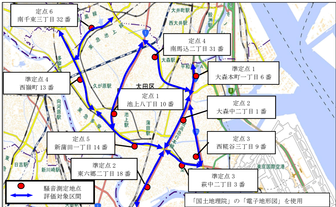
図1 調査地点概要図