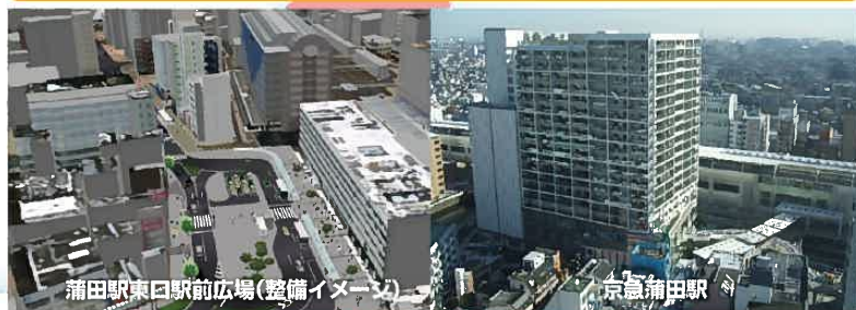
蒲田駅東口駅前広場(整備イメージ)