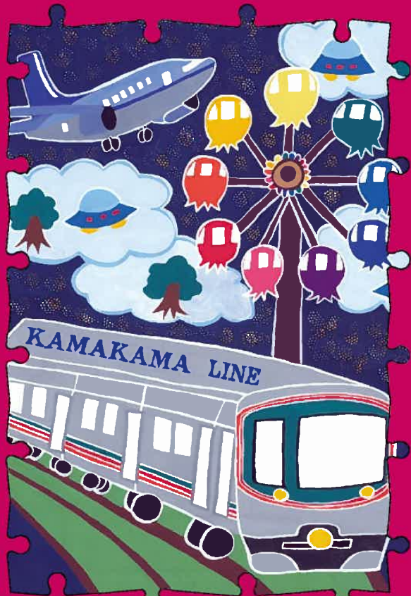
新空港線（蒲蒲線）絵画コンクール最優秀賞作品