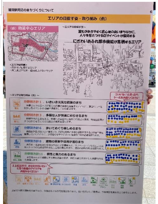
※ シール青色が東口駅前広場、黄色が西口駅前広場