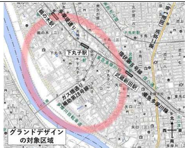
ランドデザインの対象区域