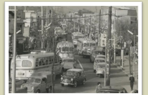
昭和30年代のまちの様子 ※昭和37年撮影 池上通り 中央二丁目にて

昭和30年代に昭和島（京浜三区）に羽田鉄工団地が建設されたのを始めとして、いくつかの公害防止を目的とした工場集団化事業が行われました。しかし、市街地では依然として公害防止対策に苦しむ中小工場が多く存在し、これらの企業は市街地から隔離された港湾埋立地への移転を東京都に繰り返し要望していました。東京都はこの要望を受け、昭和45年、造成途中の京浜6区埋立地（現在の京浜島です）を公害工場移転集団化用地として利用する意志を定めました。昭和46年には「都民を公害から防衛する計画」を策定して公害から都民の健康を守るための総合的な施策を計画しました。（京浜島連合会N）