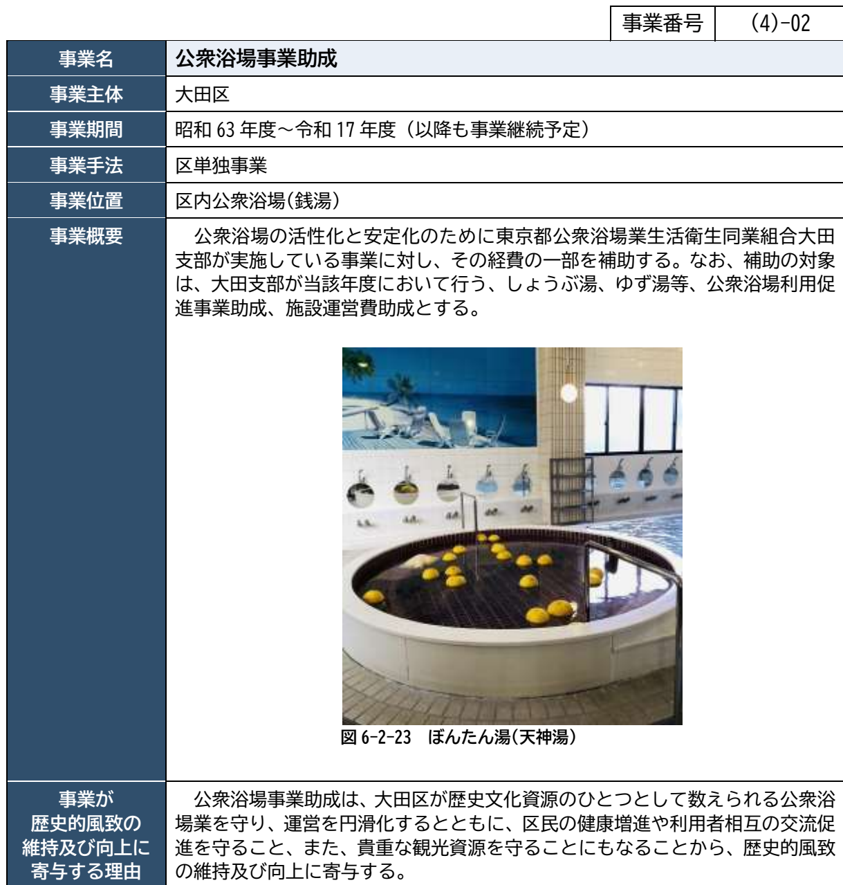
図 6-2-23 ぼんたん湯(天神湯)