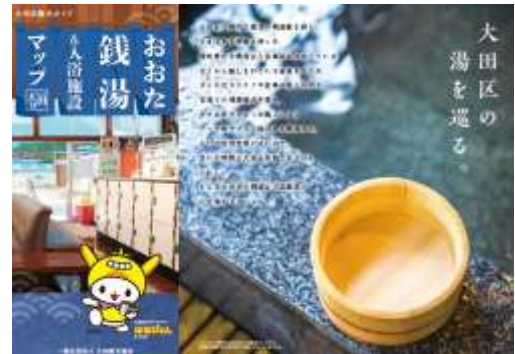
図 6-2-25 情報マップ