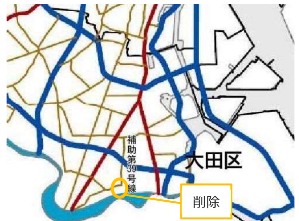
防災都市づくり推進計画 基本方針（令和 7 年 3 月）