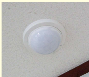
(直径約 15cm 設置イメージ)