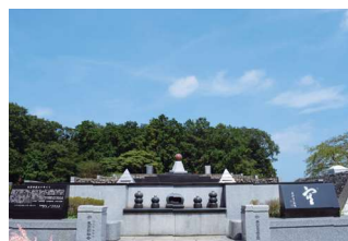
慰霊堂(埼玉県入間郡毛呂山町)