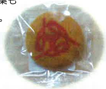
「おおむすび」のロゴマークの入ったクッキー

また、午後には一般の方々に向けて内覧会を開き、グランドオープン記念に、「おおむすび」(*)のロゴマークの入ったクッキーも配布しました。特に、重症心身障害児(者)の方を対象とする短期入所を希望される当事者の方やご家族の方には、「利用を考えている」、「近くて助かる」などのお言葉もいただき、期待の高さがうかがえました。